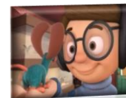
RATÓN EN VENTA

https://www.youtube.com/watch?v=qzX_nbF6pfQ