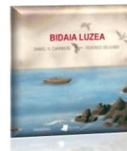
BIDAIA LUZEA Daniel Chambers/Federico delicado

Hau aldi berean gertatzen diren bi bidaiaren istorioa dugu.