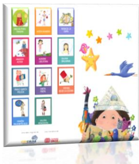
CUENTOS QUE ILUSIONAN-ONCE

El objetivo de esta colección de lecturas es mostrar las vivencias de niños y niñas con discapacidad a través de sus divertidas aventuras .